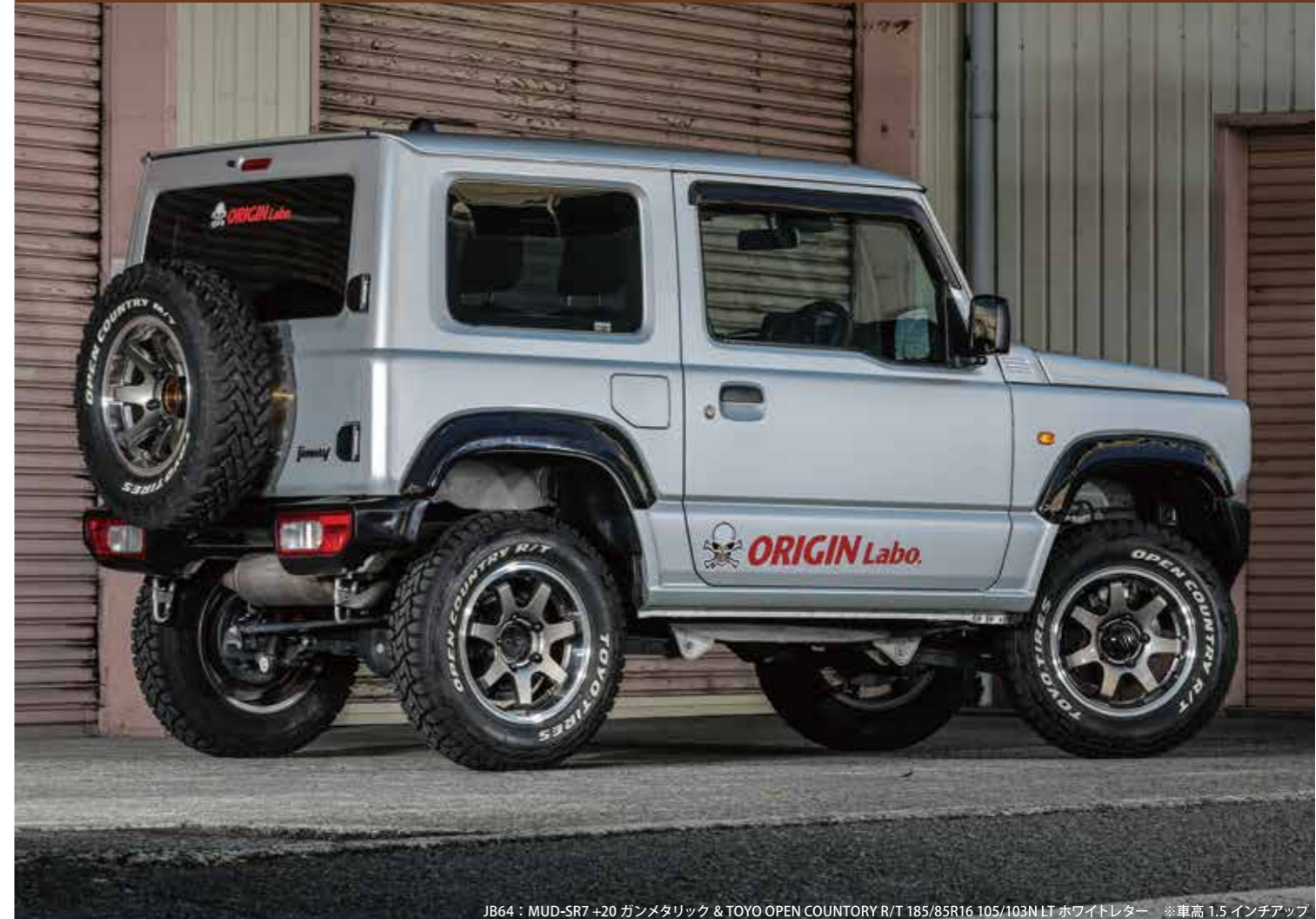
JB64 : MUD-SR7 +20 ガンメタリック & TOYO OPEN COUNTRY R/T 185/85R16 105/103N LT ホワイトレター ※車高 1.5 インチアップ

エッジの効いたセブンスポークがコンケイヴスタイルをより一層強調。実戦で鍛え抜かれたホイール。