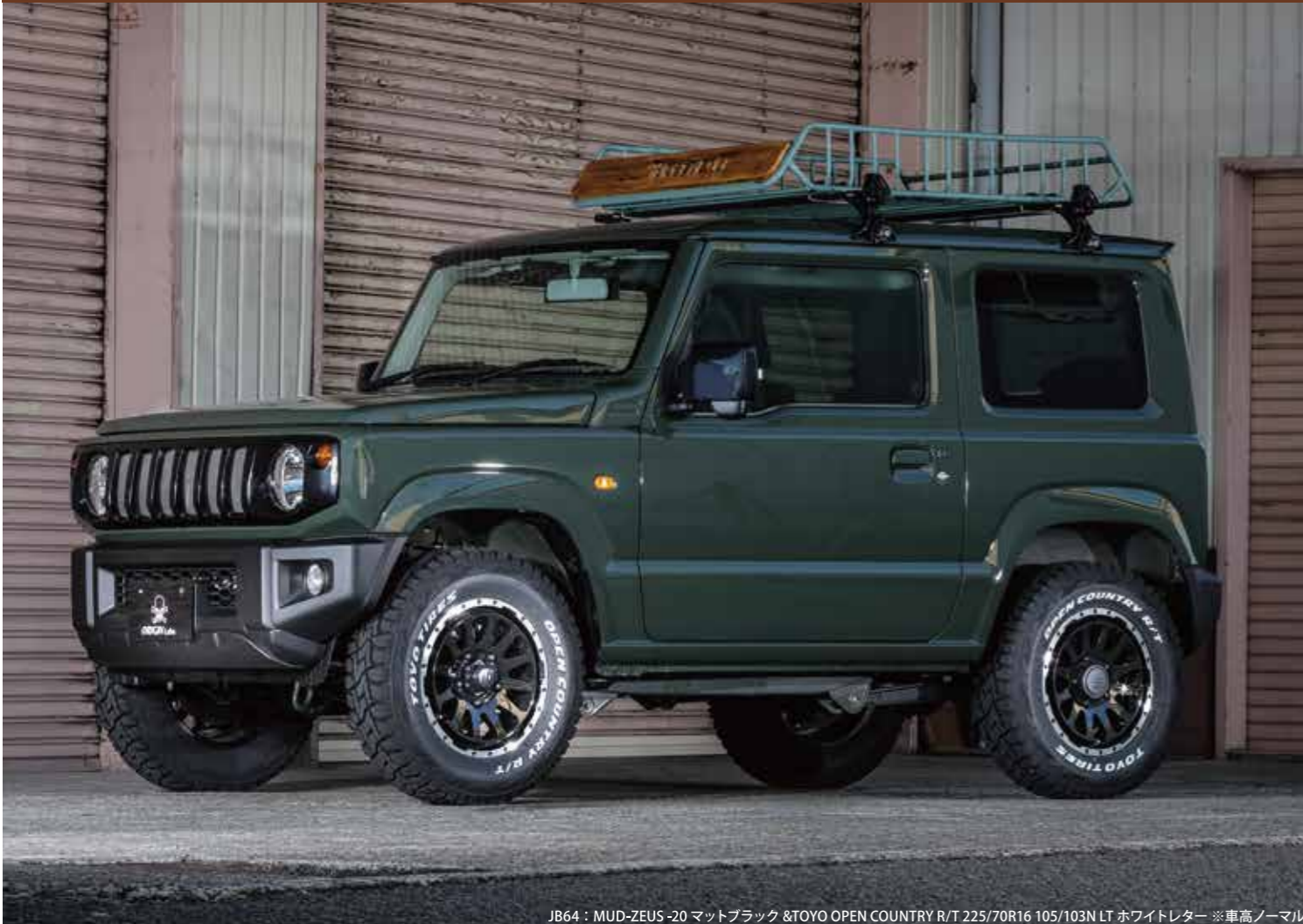
JB64 : MUD-ZEUS -20 マットブラック & TOYO OPEN COUNTRY R/T 225/70R16 105/103N LT ホワイトレター ※車高ノーマル

スポークデザインとディスクデザインの良質な融合が実現したオールユーザー必見ホイール。