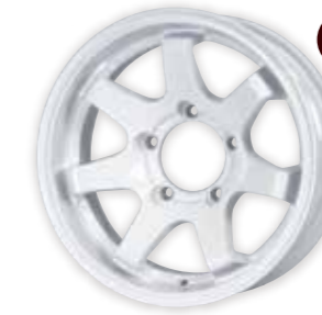
シャインホワイト

SIZE:16×5.5J HOLE:5 P.C.D:139.7 付属品:エアバルブ 素材:アルミ ※JWL、JWL-T、VIA規格適合