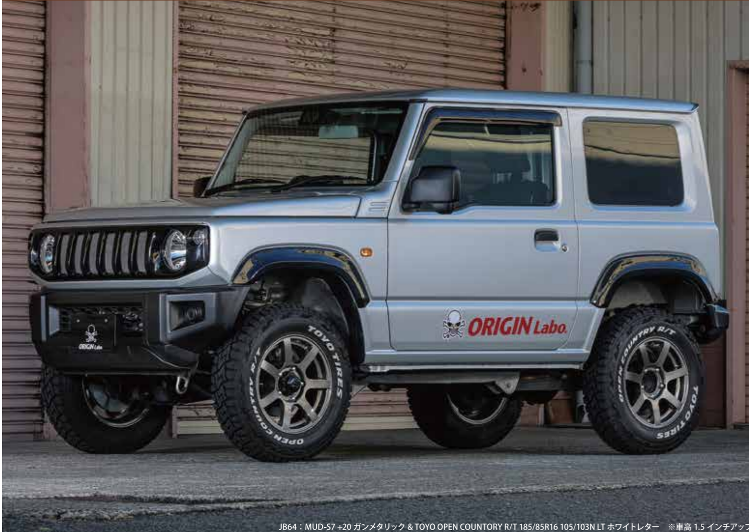
JB64 : MUD-S7 +20 ガンメタリック & TOYO OPEN COUNTRY R/T 185/85R16 105/103N LT ホワイトレター ※車高 1.5 インチアップ

力強いセブンスポークがリムエンドまで伸びきったビッグスタイル。タフさを身につけた本格派ホイール。