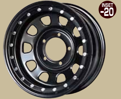
ブラック(ビードロックテスト) ¥19,800/本