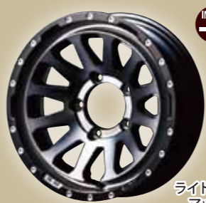
ライトブラックコート & マットブラックリム