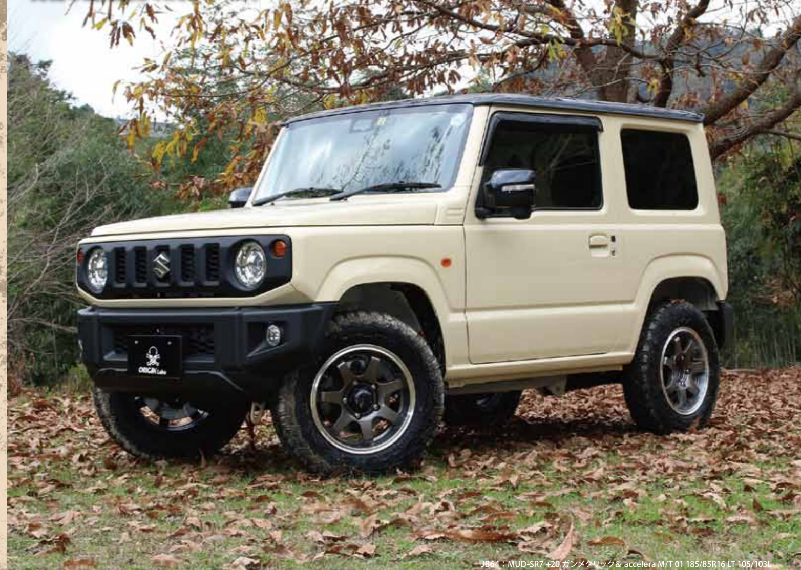
JB64 : MUD-SR7 +20 ガンメタリック & accelera M/T 01 185/85R16 LT 105/103I