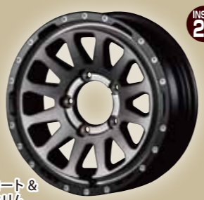
ライトブラックコート & マットブラックリム ¥27,500/本