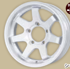
シャインホワイト