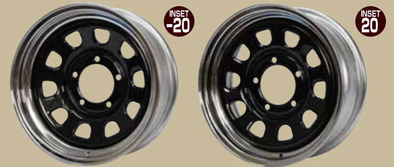
ブラックディスク&クロームリム ¥20,900/本