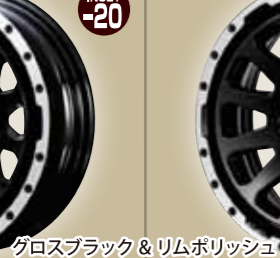
グロスブラック & リムポリッシュ