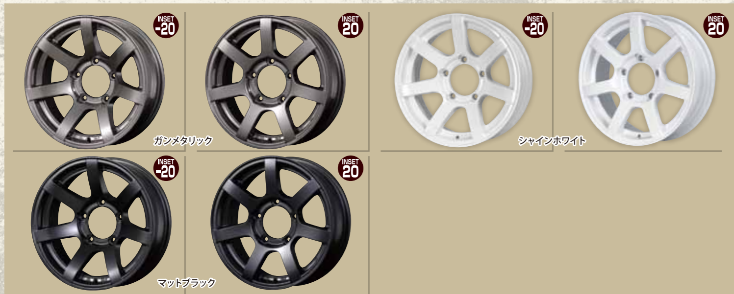
SIZE:16×5.5J HOLE:5 P.C.D:139.7 付属品:エアバルブ 素材:アルミ ※JWL、JWL-T、VIA規格適合