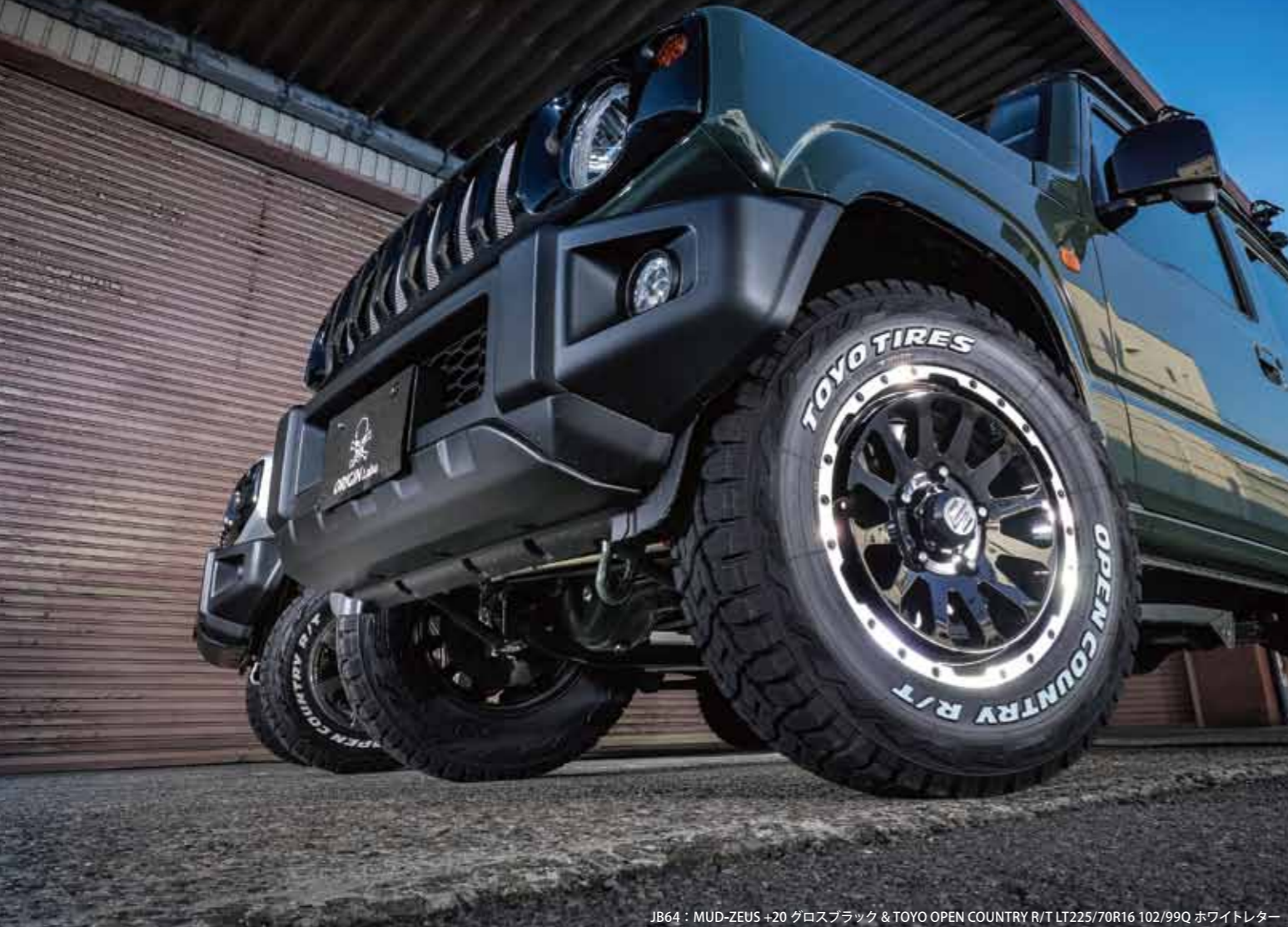
JB64 : MUD-ZEUS +20 グロスブラック & TOYO OPEN COUNTRY R/T LT225/70R16 102/99Q ホワイトレター