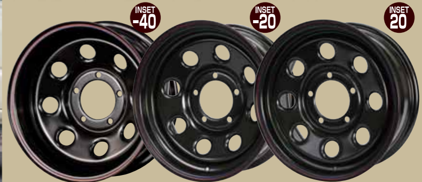
ブラック(レッド&ブルーライン) ¥12,100/本