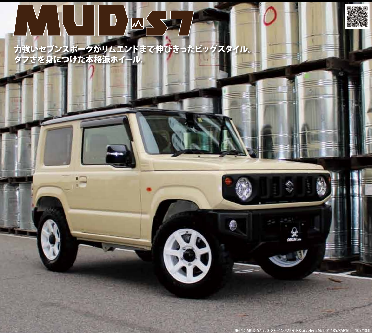
JB64 : MUD-57 +20 シャインホワイト & accelera M/T01 185/85R16 LT 105/103L