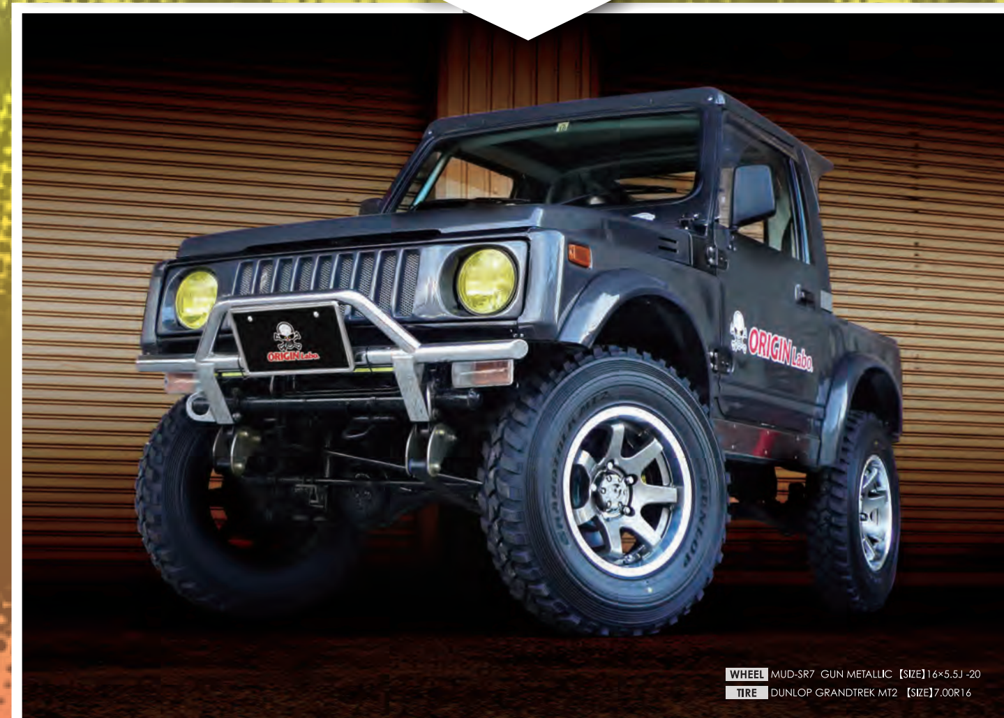
WHEEL MUD-SR7 GUN METALLIC 【SIZE】16×5.5J -20 TIRE DUNLOP GRANDTREK MT2 【SIZE】7.00R16