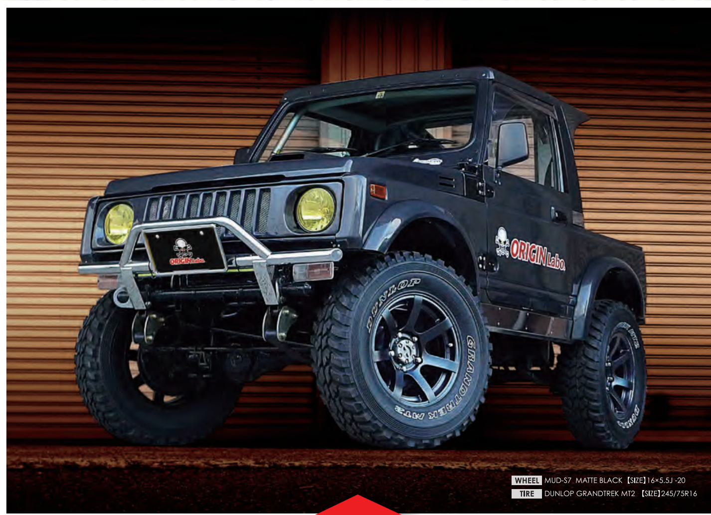
WHEEL MUD-S7 MATTE BLACK 【SIZE】16×5.5J -20 TIRE DUNLOP GRANDTREK M12 【SIZE】245/75R16